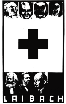
➤ Muzički biennale, 1983.; Ausstellung Laibach Kunst, pozivnica, Zagreb, 1983.; Ljubljana, Zagreb, Beograd, plakat, 1987.; Smrt ideologije, 1982.

internetske stranice dizajn.hr i od 2011. voditelj galerije HDD-a Hrvatskog dizajnerskog društva.