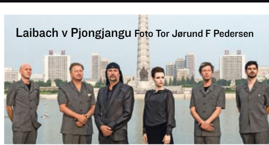
Laibach v Pjongjangu