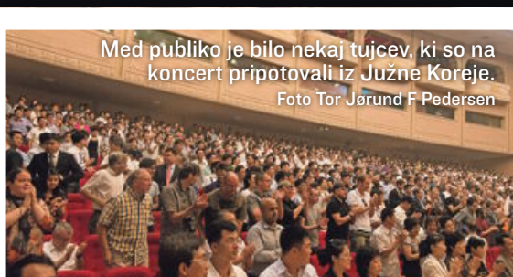
Med publiko je bilo nekaj tujcev, ki so na koncert pripotovali iz Južne Koreje.