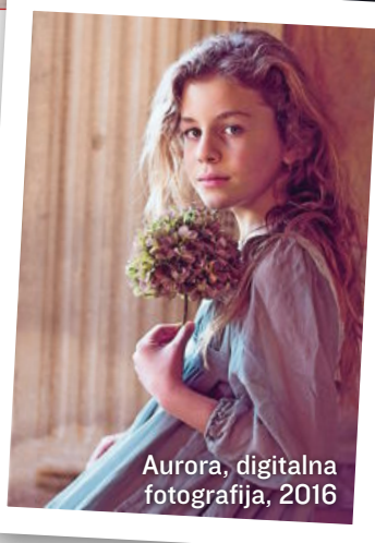
Aurora, digitalna fotografija, 2016

Mitu, da fotografija med upodabljalnimi umetnostmi najbolj avtentično prikaže realnost, že dolgo ne verjamemo več. Odnos med realnim in upodobljenim, med fikcijo in resnico, med življenjem in umetnostjo, je bil navzoč tudi pri nastajanju teh portretov otrok. Barbara Gregurič Silič v samosvoje kompozicije, ki vključujejo arhitekturo in rastline, postavlja deklice in dečke različnih starosti, od triletnice do najstnic in najstnikov. Tako so njene fotografije svojevrstne genske mešanice otroških modelov, rastlin in aristokratskega okolja. Na portretnih upodobitvah posameznih otrok avtorica združuje naturalizem in iluzijo. Portretirani otroci so postavljeni v nenavadne situacije in neobičajne poze, opremljeni so z različnimi atributi: s posušeno rožo v barvi prosojne obleke, s črno žametno pentljo okoli ovratnega naborka, s pleteno punčko z naočniki, z violončelom ali z odprto starinsko knjigo. Ti njeni portreti otrok, s katerimi se v resnici ni mogla sporazumevati v njihovem jeziku, a si je morala drugače