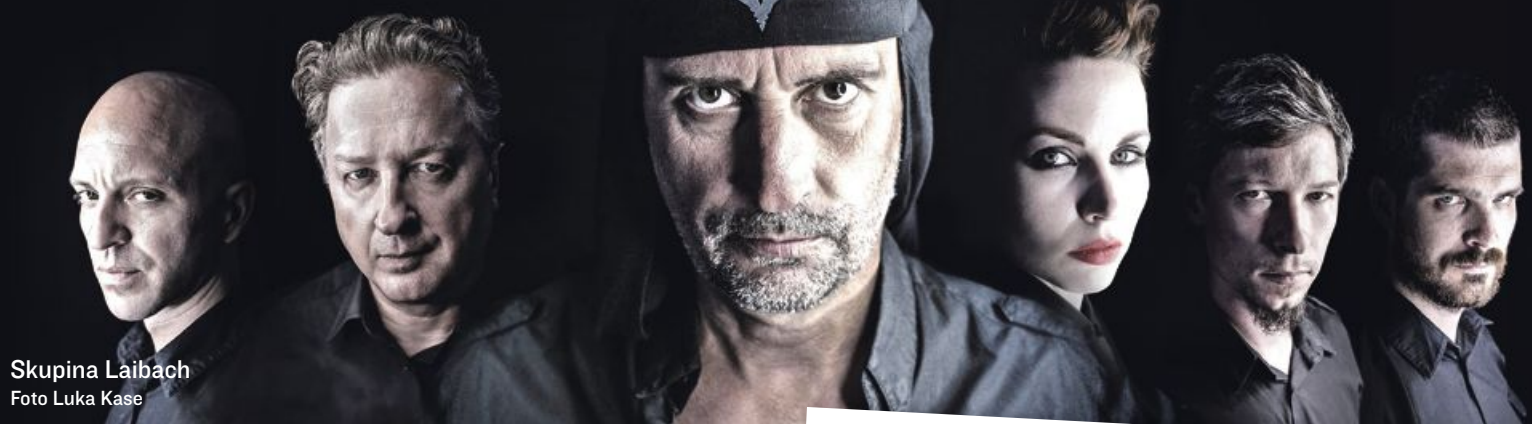
Skupina Laibach