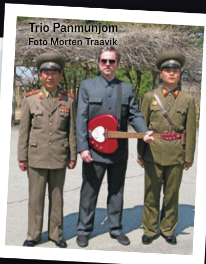
Trio Panmunjom