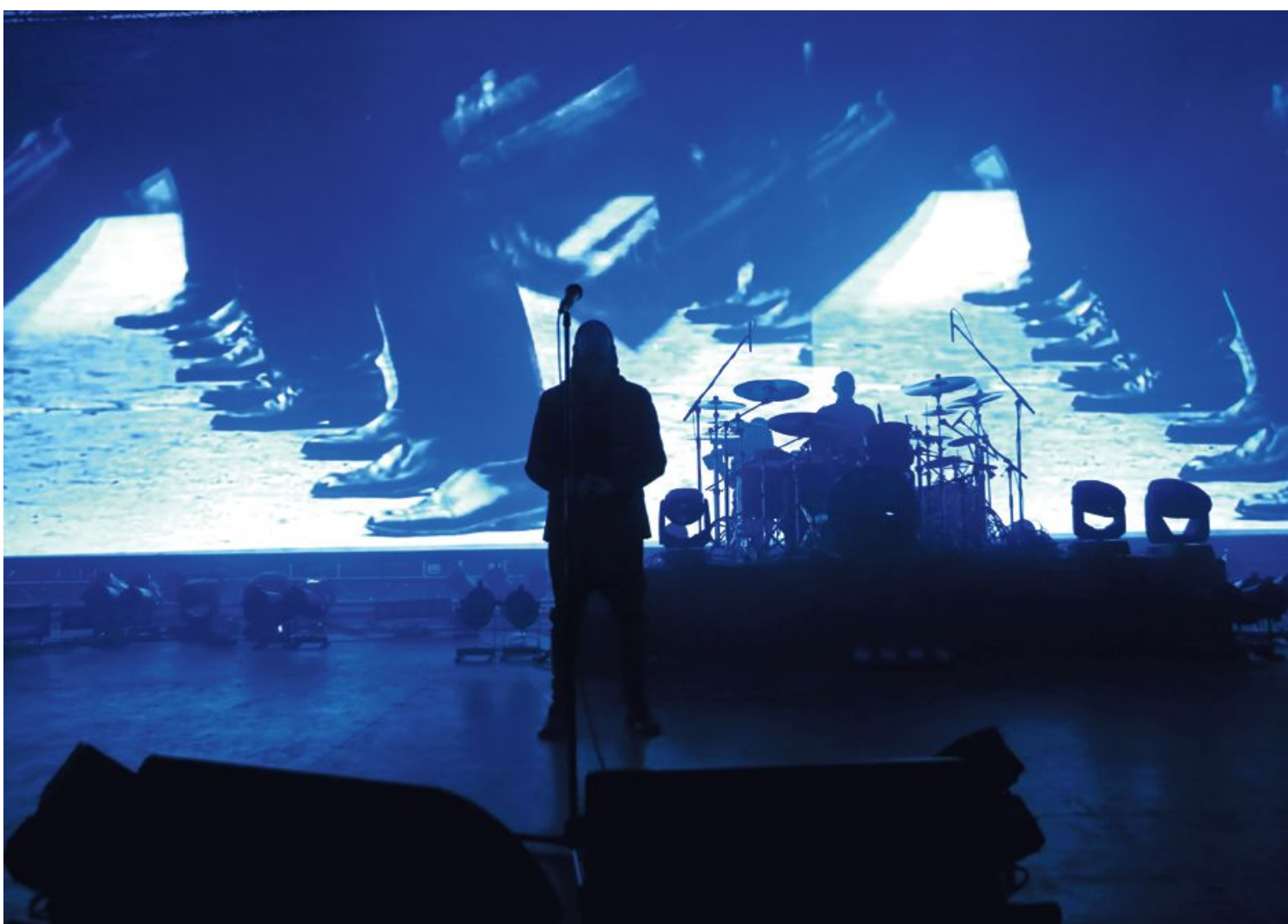
Laibach lani na koncertu v ljubljanskih križankah ob predstavitvi zadnje plošče Spectre

Francoskemu Obskure (in večini drugih medijev) so po dodali: »V Severno Korejo ne gremo, da bi jih provocirali, temveč da bi provocirali vse druge po svetu.«