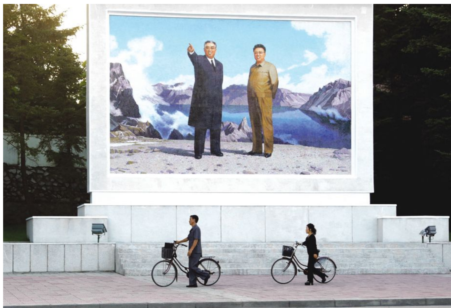
Te dni na ulici: severnokorejski vsakdanjik z voditeljema Kum Il Sungom (levo) in Kim Džong Ilom