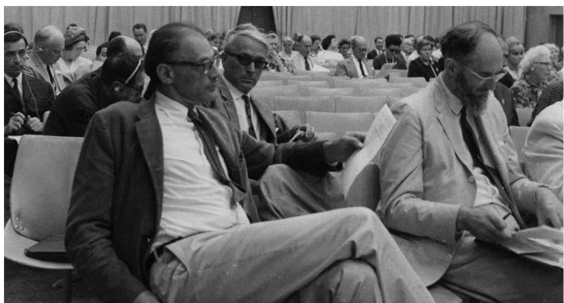
Leta 1965 je slovenski Pen na Bledu priredil svetovni kongres organizacije.