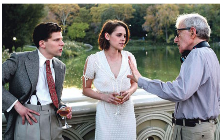
Film Café Society Woodyya Allena (desno) z igralcem Jessejem Eisenbergom in Kristen Stewart odpira canski festival.

Za zlato palmo se bodo potegovali še nizozemski veterani Paul Verhoeven,